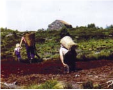
Dei bar den tørka molda i kiper til lagring i moldhuset.