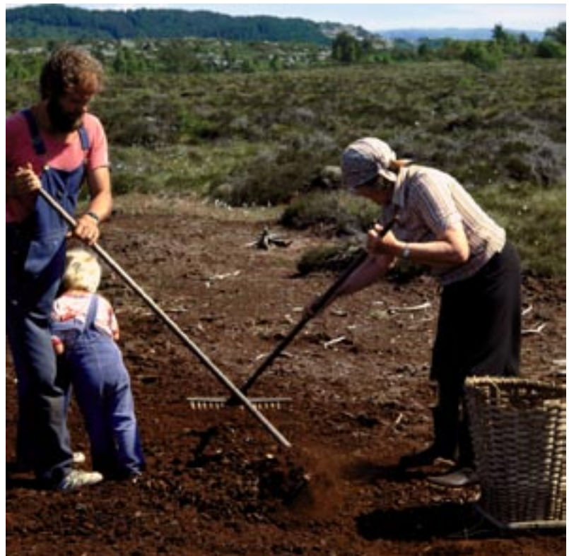
Den tørre molda vart raka saman og spadd opp i kiper.